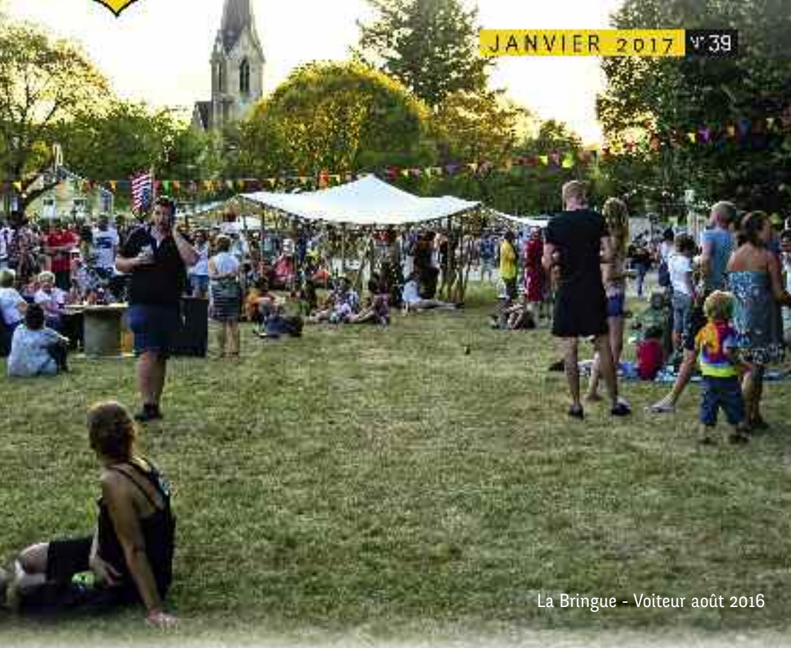
La Bringue - Voiteur août 2016