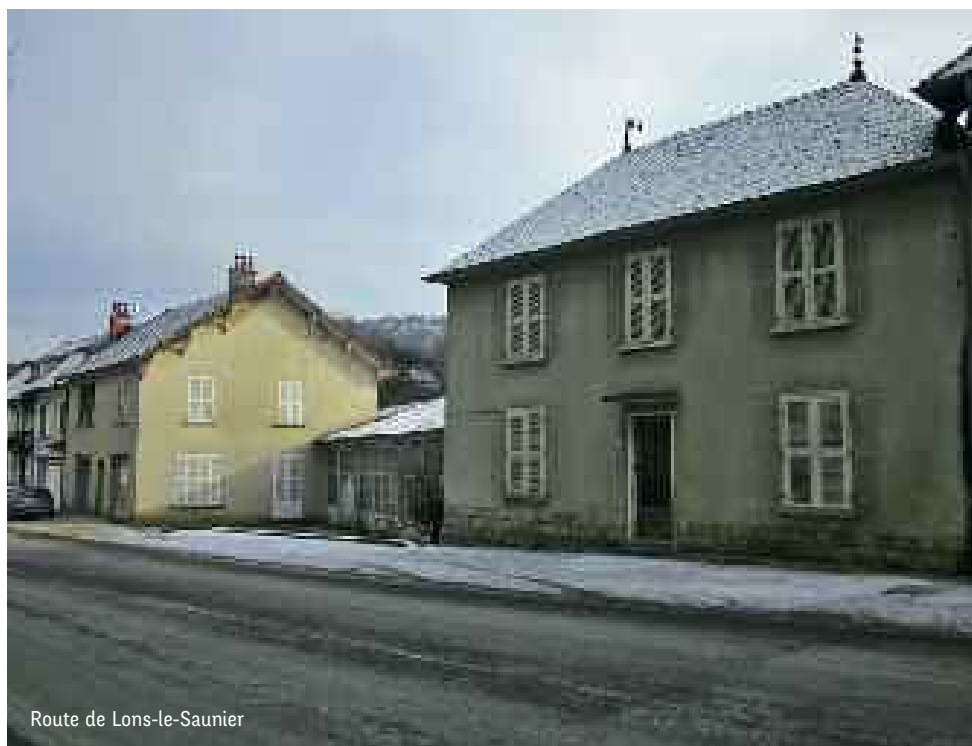
Route de Lons-le-Saunier

À la conception du bâtiment, le principe d'installer une climatisation n'avait pas été retenu. La structure du bâtiment devait permettre d'obtenir une inertie suffisante pour qu'une régulation thermique se réalise naturellement la nuit, et une restitution en journée. Force est de constater qu'il n'en est rien.