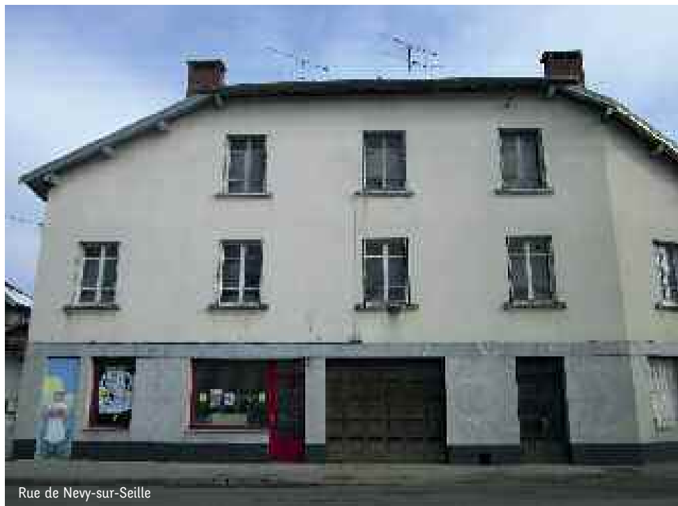
Rue de Nevy-sur-Seille

En 2016, le montant total du programme d'investissement de la commune s'élève à 355 000 € pour le budget général, et à 192 000 € pour le budget annexe eau et assainissement. Notre capacité d'autofinancement nous permet