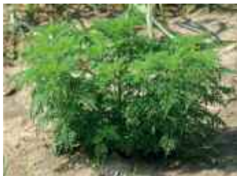
Port de la plante en buisson

Pour toute question technique relative à la lutte contre l'ambrosie, la Fédération régionale de lutte contre les organismes nuisibles (FREDON : www.fredonfc.com ) de Bourgogne Franche-Comté est là pour répondre à vos questions (03 81 47 79 23 – lrebillard@fredonfc.com ).