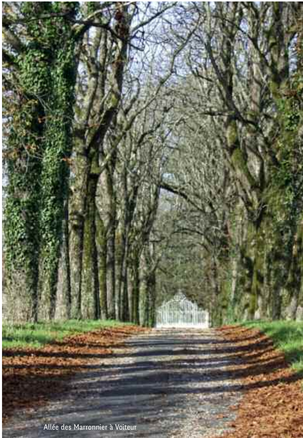
Allée des Marronnier à Voiteur