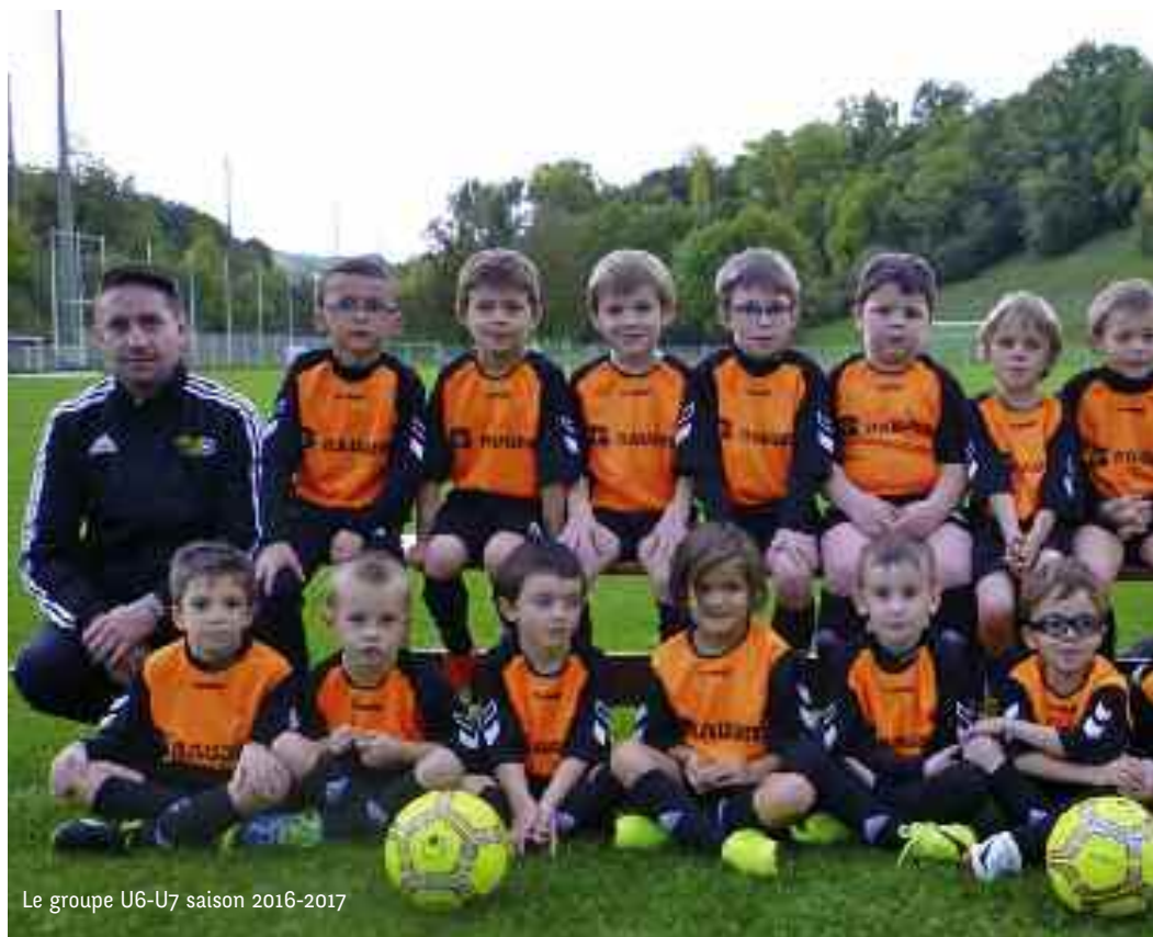
Le groupe U6-U7 saison 2016-2017